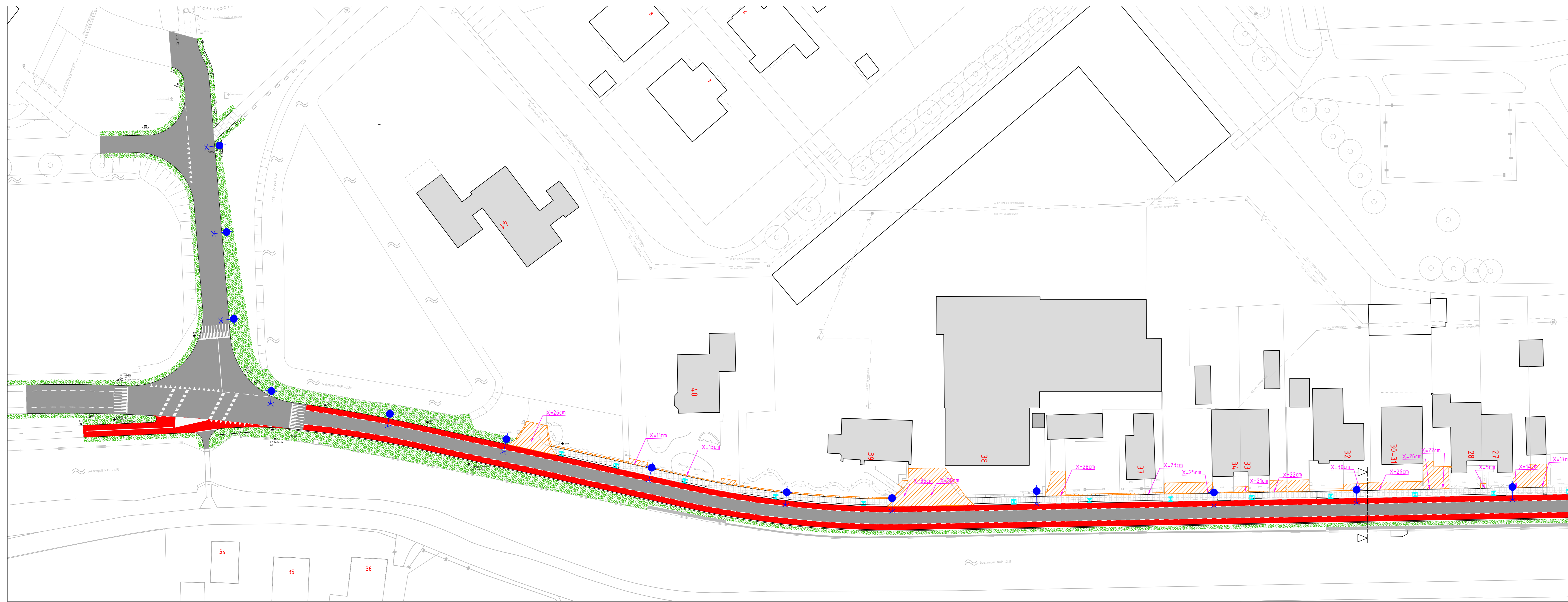
NIEUWE SITUATIE - DEEL 1