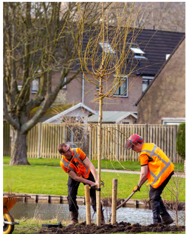
Nieuwe bomen die beter tegen ziektes bestand zijn.

Houd op Facebook Like je Wijk Lombardijen in de gaten voor alle informatie.