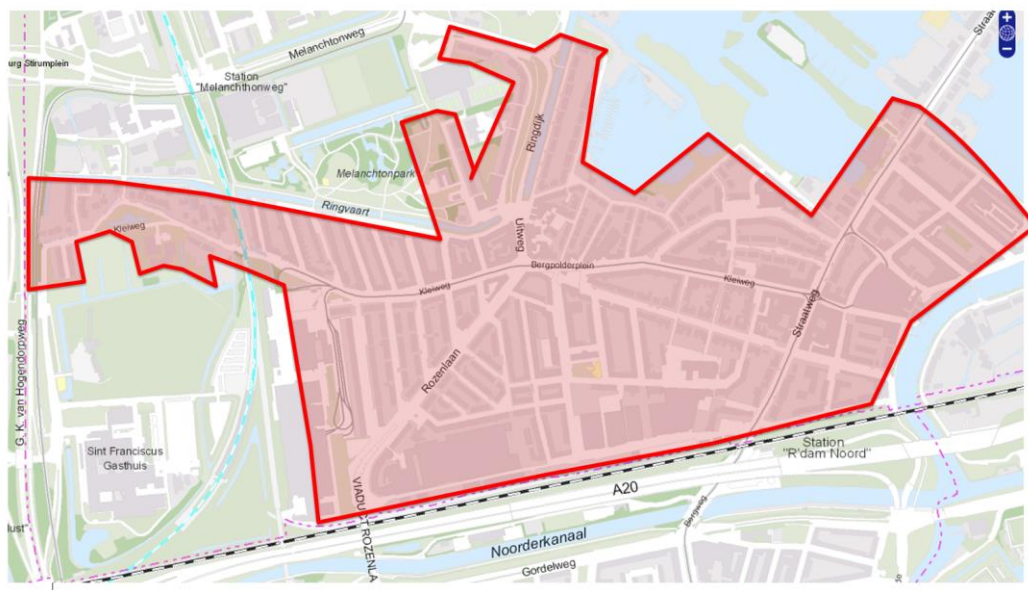
Figuur 1. Onderzoeksgebied Kleiwegkwartier

Gezien het grote aantal subbuurten binnen het onderzoeksgebied is besloten het onderzoeksgebied Kleiwegkwartier in vijf deelgebieden op te delen (zie Figuur 2).