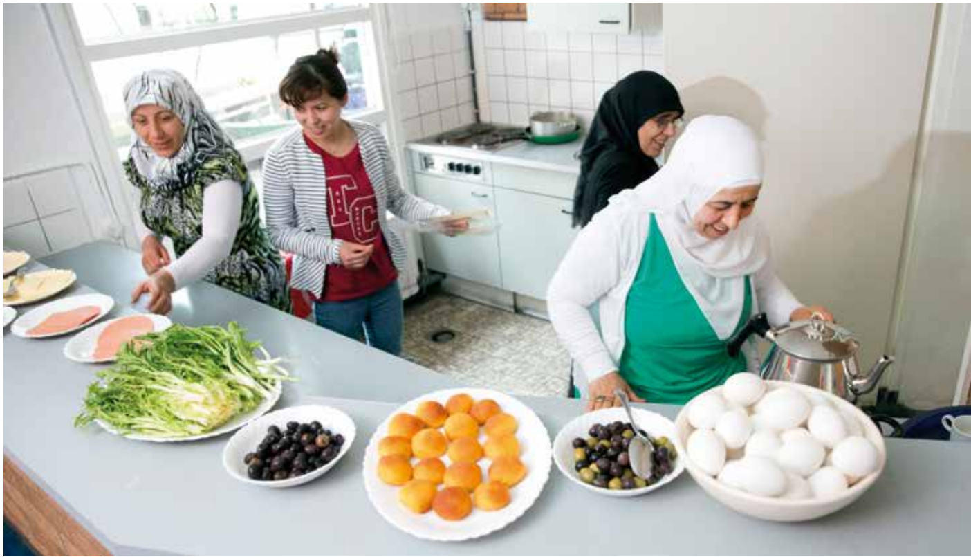
De Tegenprestatie Gemeente Rotterdam