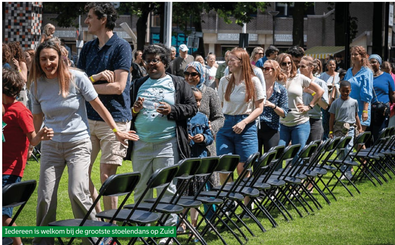
Iedereen is welkom bij de grootste stoelendans op Zuid