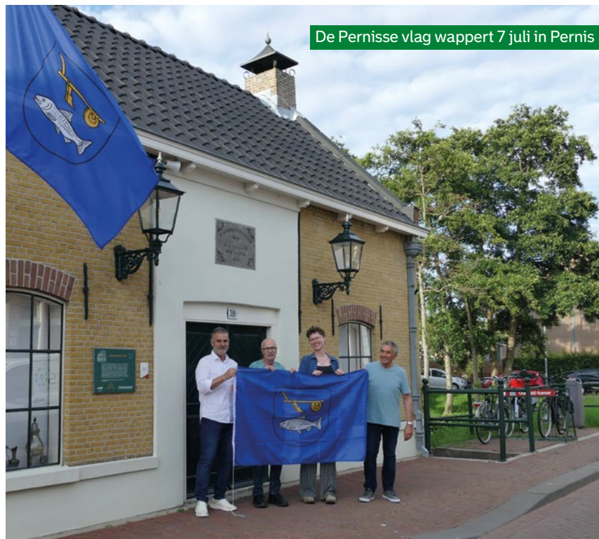
De Pernisse vlag wappert 7 juli in Pernis