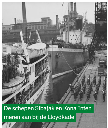
De schepen Sibajak en Kona Inten meren aan bij de Lloydkade

Een bijzondere groep binnen deze migratie zijn de Molukkers. Generaties lang hebben Molukse mannen gediend in het Koninklijk Nederlands-Indisch Leger (KNIL). Als Indonesië onafhankelijk wordt en het Indonesische leger de Molukken bezet, zijn zij hun leven niet zeker. Daarom worden in 1951 zo'n 4.000 Molukse mannen en hun gezinnen naar Nederland gebracht, ruim 12.500 in totaal.