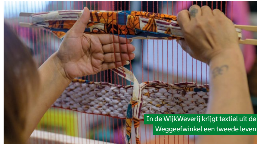
In de WijkWeverij krijgt textiel uit de Weggeefwinkel een tweede leven

Het initiatief ontstond vanuit de Weggeefwinkel, waar veel textiel binnenkomt dat niet meer geschikt is om weg te geven, bijvoorbeeld omdat het kapot is of vlekken heeft. In de WijkWeverij worden deze materialen verwerkt tot nieuwe producten. Zo worden er tafellopers gemaakt voor Huis van de Wijk Het Klooster, met daarin het nieuwe logo verwerkt. Naast hergebruik staat ontmoeting centraal. 'Het circulaire is hier natuurlijk een belangrijk kerndoel.'