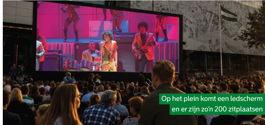
Op het plein komt een ledscherm en er zijn zo'n 200 zitplaatsen

Vrijdag 10 juli begint de openluchtbioscoop met een documentaire over de Surinaamse punkscène. Gevolgd door een film over het leven van soullegende James Brown. Zaterdag staat eerst een film op het programma over een jonge Curaçaoër naar die droomt van een carrière als