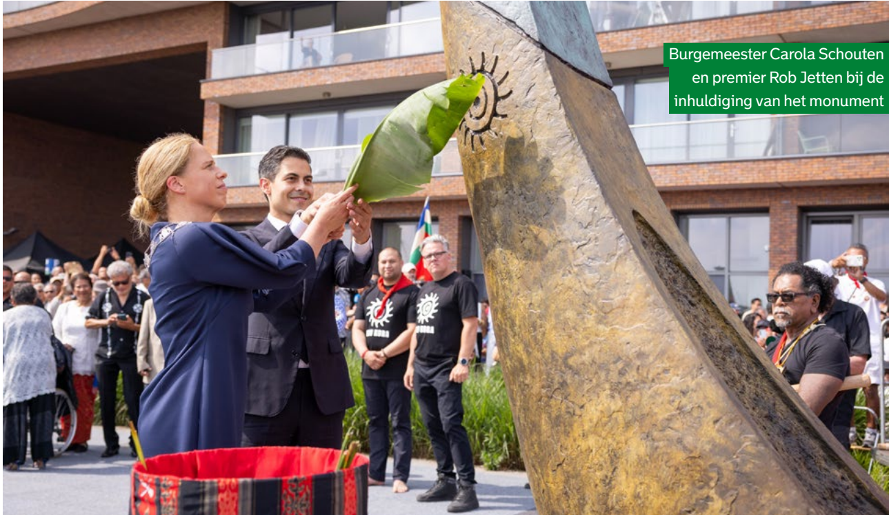
Burgemeester Carola Schouten en premier Rob Jetten bij de inhuldiging van het monument