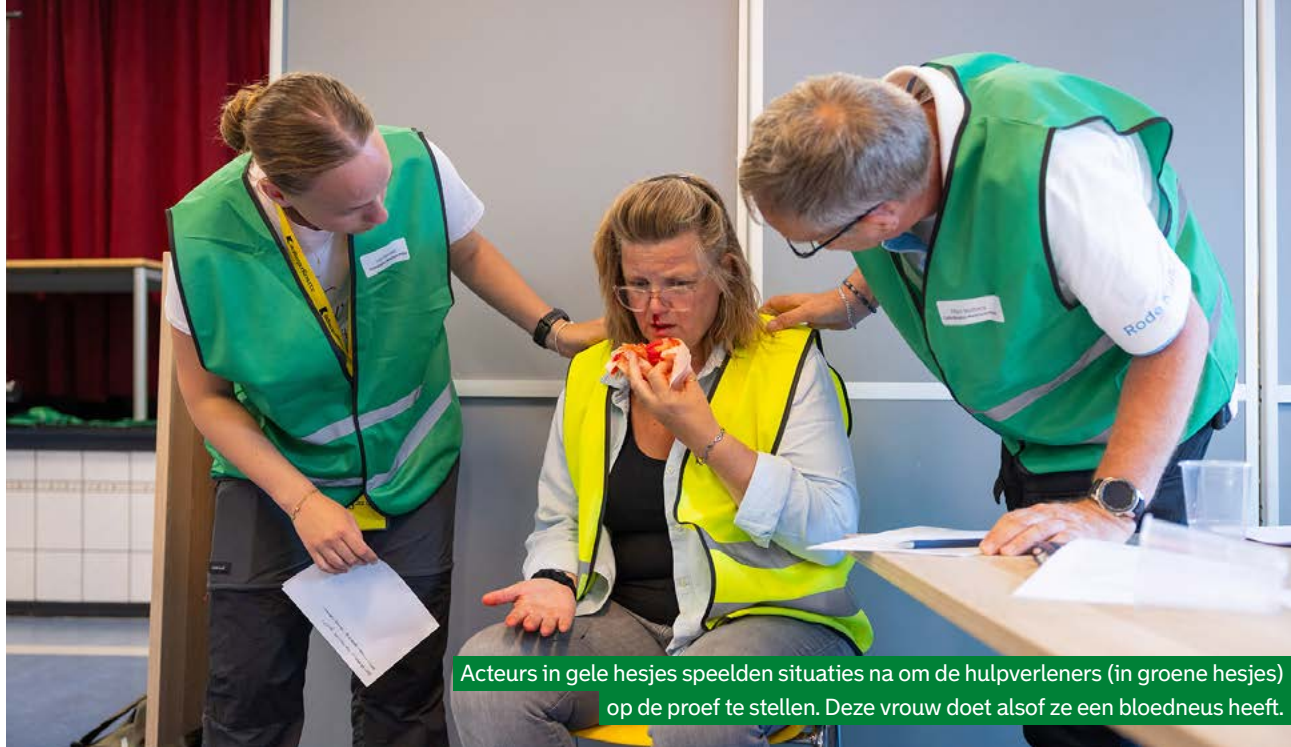
Acteurs in gele hesjes speelden situaties na om de hulpverleners (in groene hesjes) op de proef te stellen. Deze vrouw doet alsof ze een bloedneus heeft.

Zulke noodsteunpunten bestaan officieel nog niet. Maar begin juni werden er wel 3 punten ingericht in Bloemhof om te oefenen. Door te doen alsof er al 48 uur geen stroom is tijdens een hittegolf, gaan de gemeente, de Veiligheidsregio Rotterdam-Rijnmond en het Rode Kruis na wat er dan gebeurt. En wat er nodig is bij een noodsteunpunt.