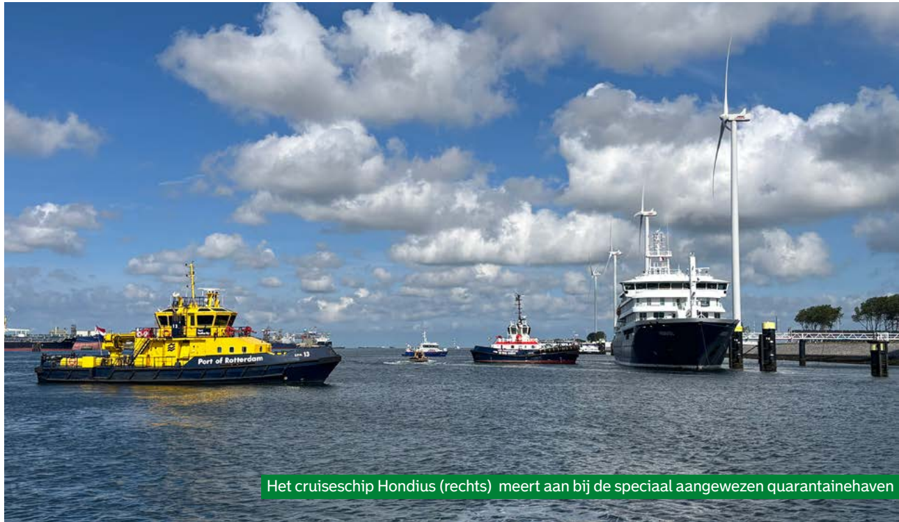
Het cruiseschip Hondius (rechts) meert aan bij de speciaal aangewezen quarantainehaven

'Op vrijdag lag er een ondergrond, op zaterdag zijn we gaan bouwen en op