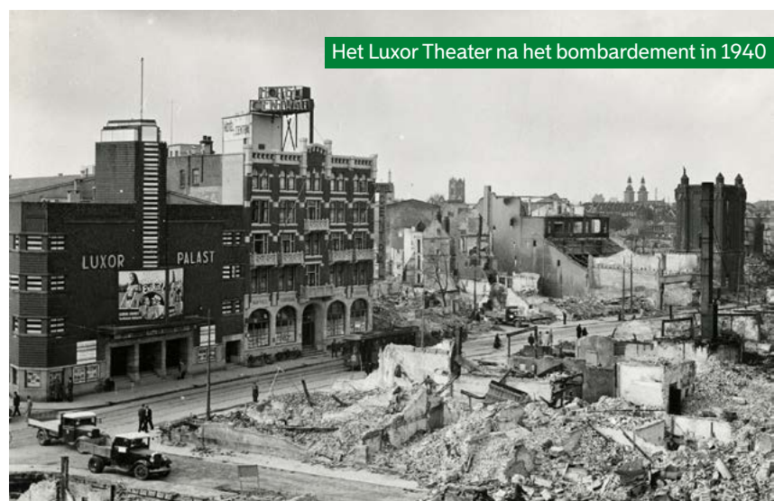
Het Luxor Theater na het bombardement in 1940

Het Nieuwe Luxor opent op 28 april 2001, dit voorjaar 25 jaar geleden. Grote internationale producties als Les Misérables trekken duizenden bezoekers naar Rotterdam en bevestigen het theater als een toonaangevend podium in Nederland. Met een geschiedenis van meer dan een eeuw is Luxor zowel een iconisch gebouw als een cultureel hart van Rotterdam geworden.