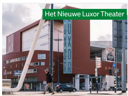
Het Nieuwe Luxor Theater

Tijdens het bombardement van 14 mei 1940 blijft Luxor als een van de weinige gebouwen in de binnenstad gespaard. Maar liefst 12 Rotterdamse bioscopen veranderen in as en puin. Om het gemis van de eveneens verwoeste Rotterdamse Schouwburg te compenseren worden in Luxor naast filmvoorstellingen tijdelijk toneelvoorstellingen vertoond. Het blijft technisch behelpen, omdat het