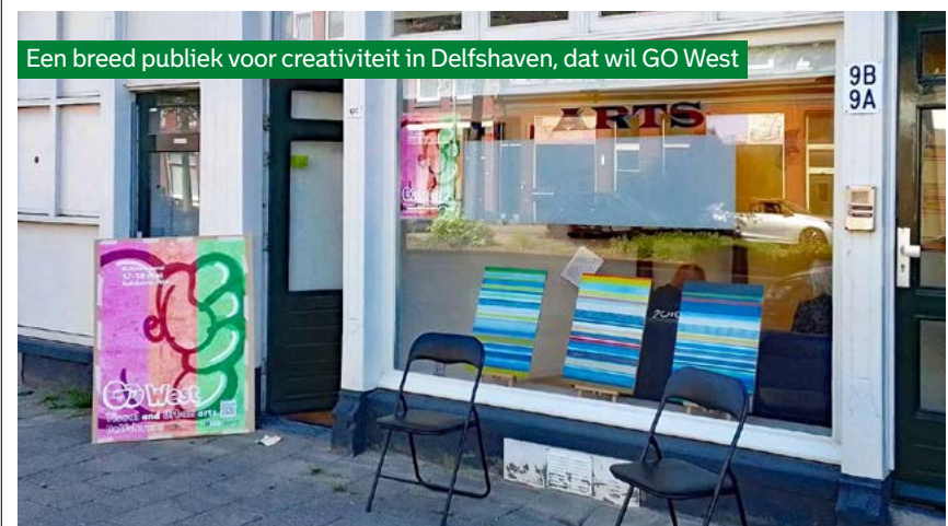
Een breed publiek voor creativiteit in Delfshaven, dat wil GO West

Alle locaties zijn op beide dagen gratis te bezoeken tussen 12.00 en 17.00 uur. Bezoekers kunnen hun eigen route plannen met een papieren plattegrond of met de interactieve kaart op de website. Kijk voor meer informatie op gowestdelfshaven.nl .