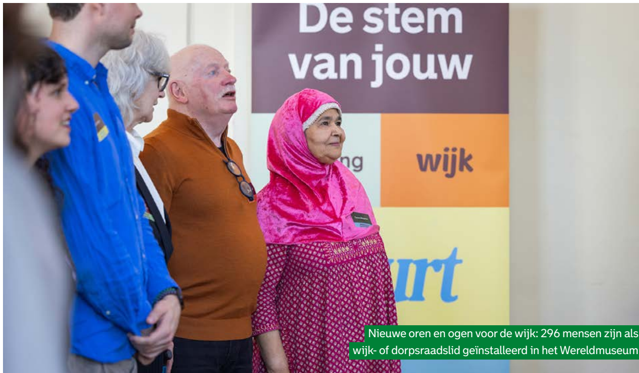
Nieuwe oren en ogen voor de wijk: 296 mensen zijn als wijk- of dorpsraadslid geïnstalleerd in het Wereldmuseum

Simons sloot af met een toast: 'Vandaag is een mooie start, maar het