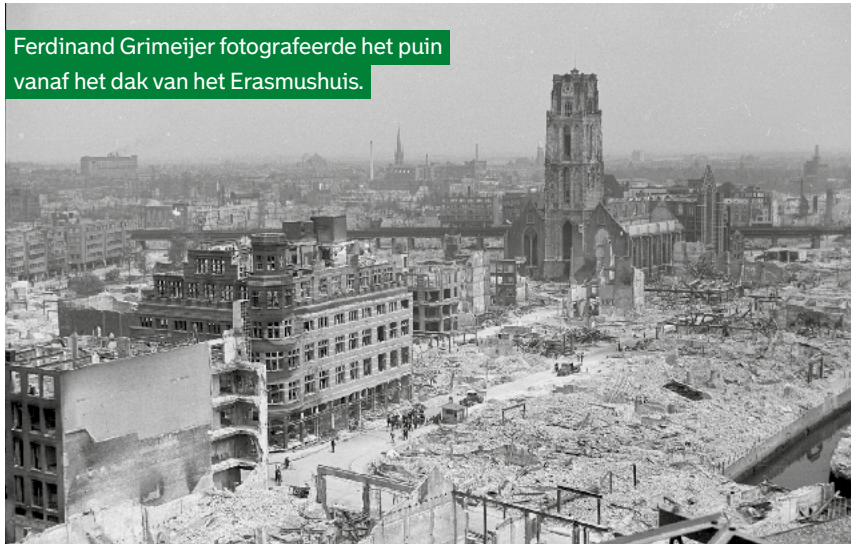
Ferdinand Grimeijer fotografeerde het puin vanaf het dak van het Erasmushuis.

Kwaaitaal schrijft in zijn puinfotoalbum dat zijn werk niet zonder gevaar was. Er kwam een muur terecht op een collega. "(...) hij wordt onder het puin bedolven, alleen zijn helm steekt er bovenuit. Wij graven hem gauw uit, hij is bewusteloos (...) en terwijl ik zijn jas losknoop golft het bloed uit zijn borst mij over de handen." De man wordt naar het ziekenhuis gebracht waar hij na 1,5 uur overlijdt.