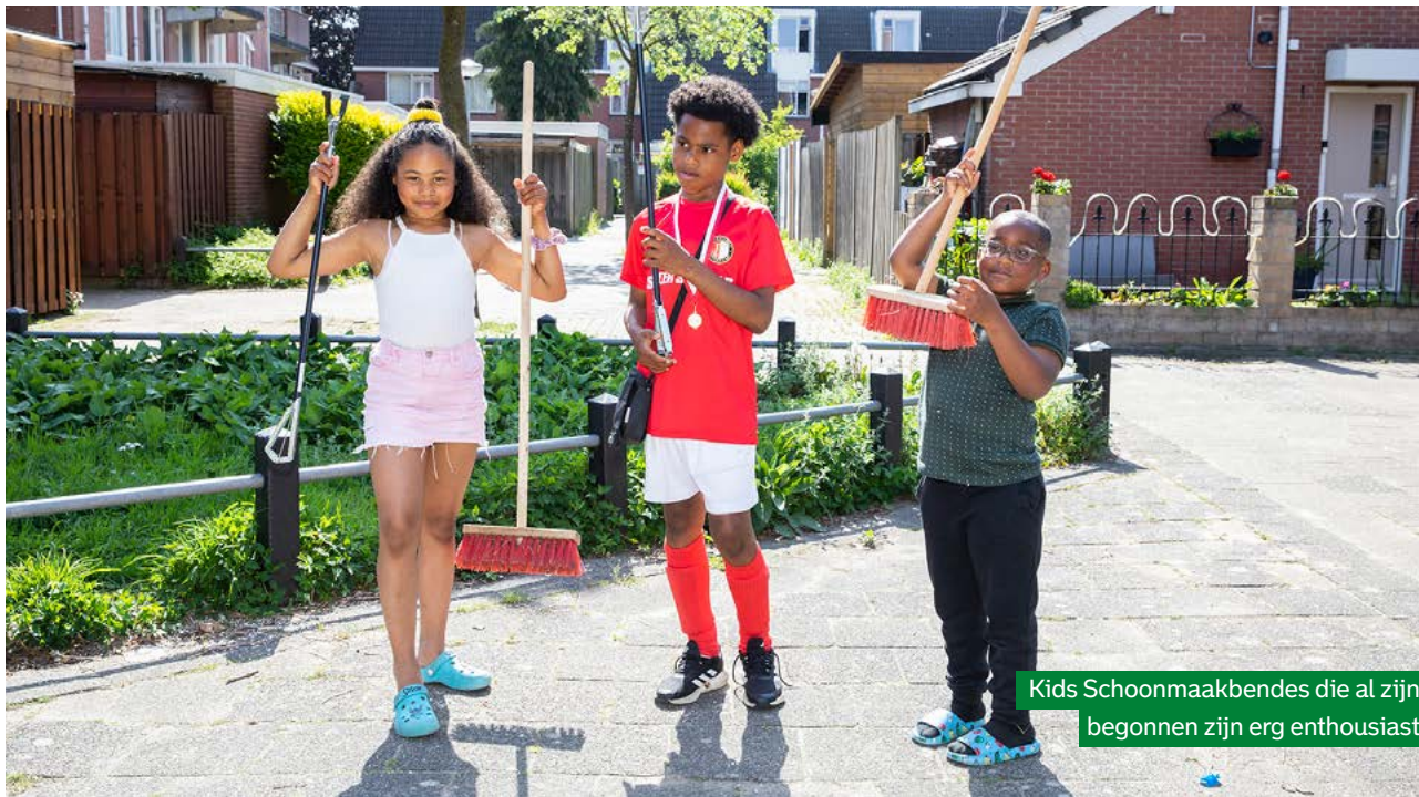
Kids Schoonmaakbendes die al zijn begonnen zijn erg enthousiast