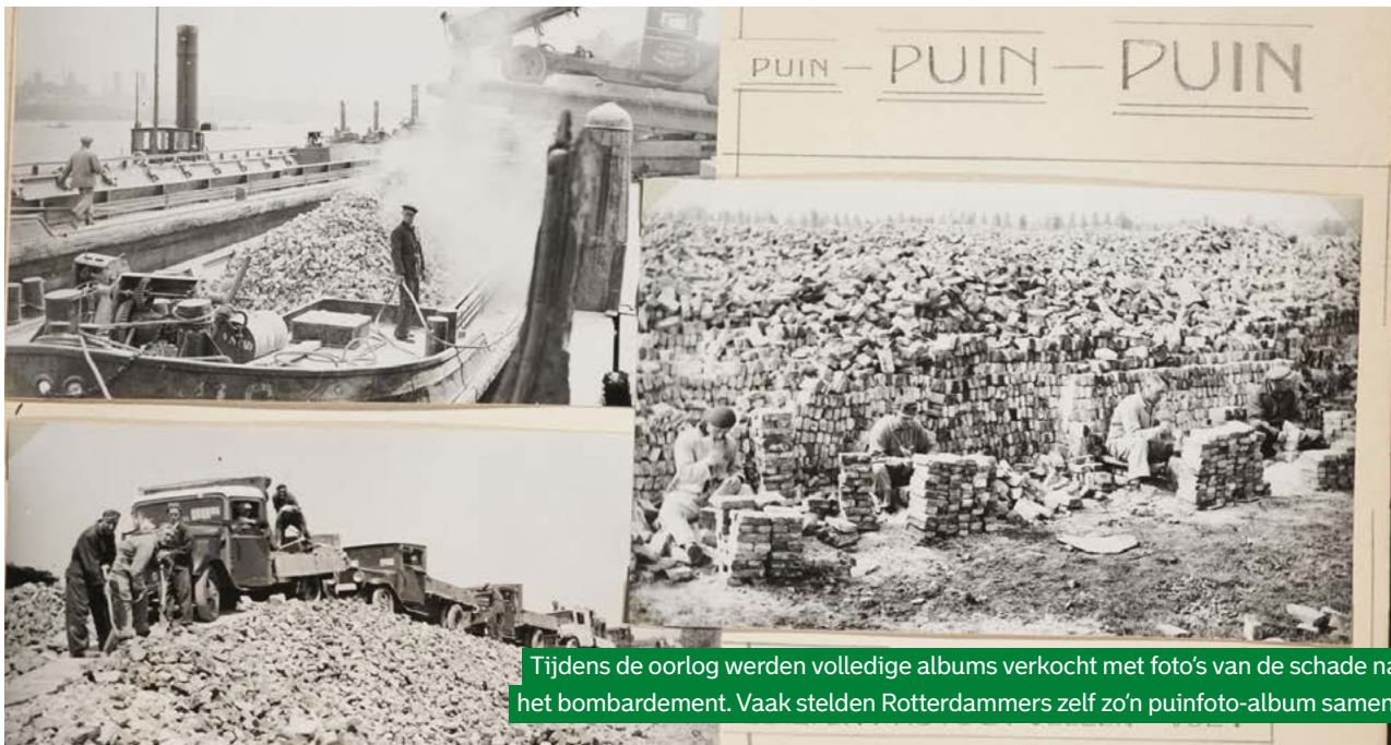
Tijdens de oorlog werden volledige albums verkocht met foto's van de schade na het bombardement. Vaak stelden Rotterdammers zelf zo'n puinfoto-album samen.

'De sfeer na de oorlog was: we kijken vooruit en die oude binnenstad was toch al niet zo mooi. Dat was hard voor sommige mensen: je hebt iets ergs meegemaakt, het hart van de stad is verdwenen. Maar jouw herinneringen liggen daar. Die wil je bewaren en laten zien. Eigenlijk was foto's delen en sparen een reactie op de wederopbouwmentaliteit.'