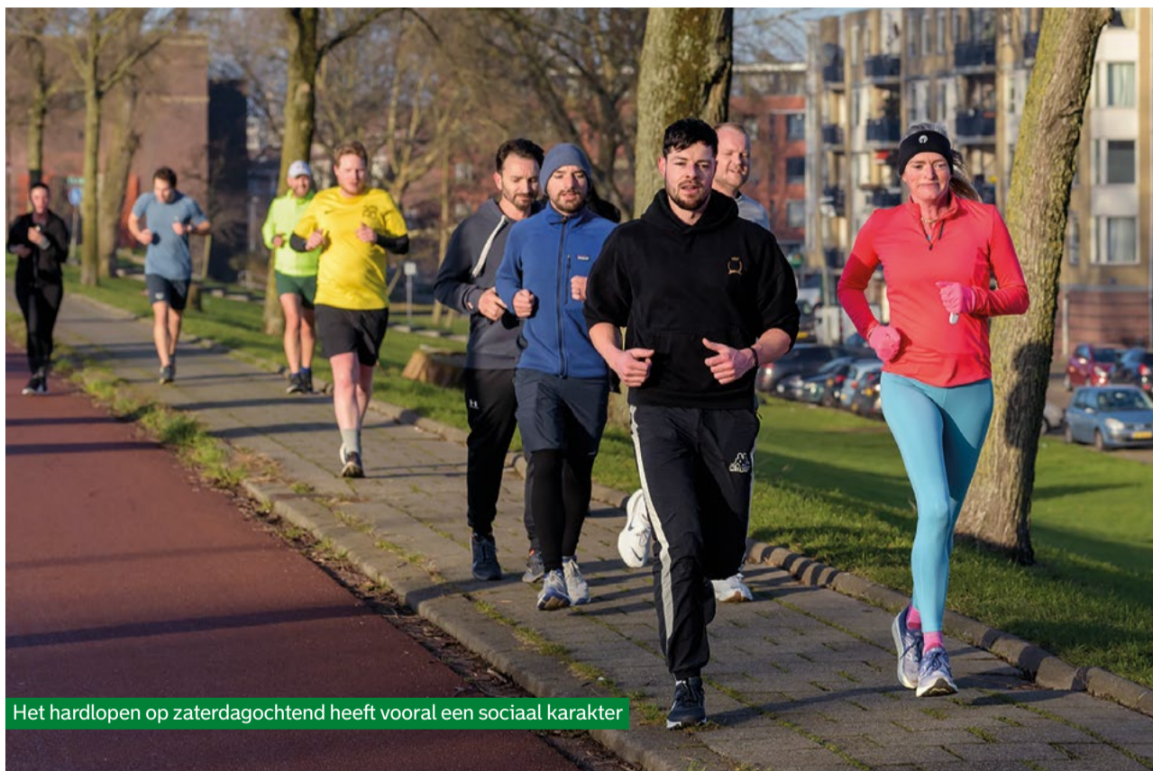
Het hardlopen op zaterdagochtend heeft vooral een sociaal karakter