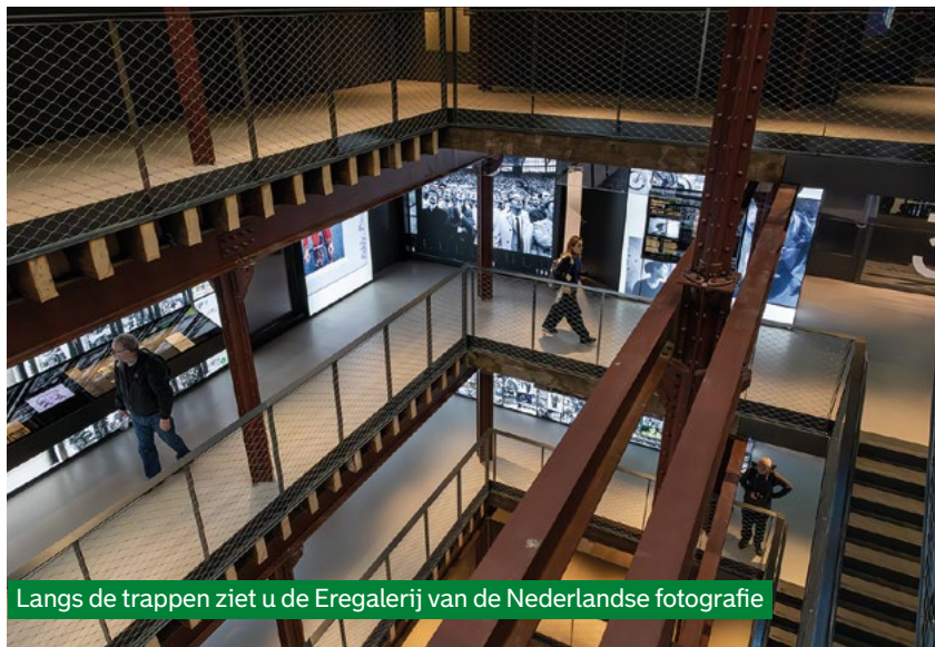
Langs de trappen ziet u de Eregalerij van de Nederlandse fotografie

Op de vierde verdieping vindt u tot en met 24 mei de expositie 'Rotterdam in focus. Fotografie van de stad 1843 – nu'. Aan de hand van 350 foto's loopt u zo door de geschiedenis van meer dan 180 jaar fotografie in Rotterdam. De foto's zijn gemaakt door zowel professionele als amateurfotografen.