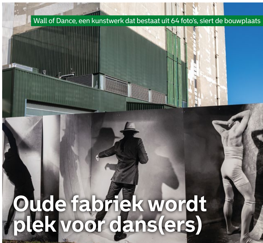
Wall of Dance, een kunstwerk dat bestaat uit 64 foto's, siert de bouwplaats