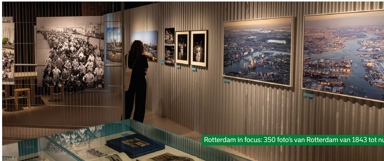
Rotterdam in focus: 350 foto's van Rotterdam van 1843 tot nu