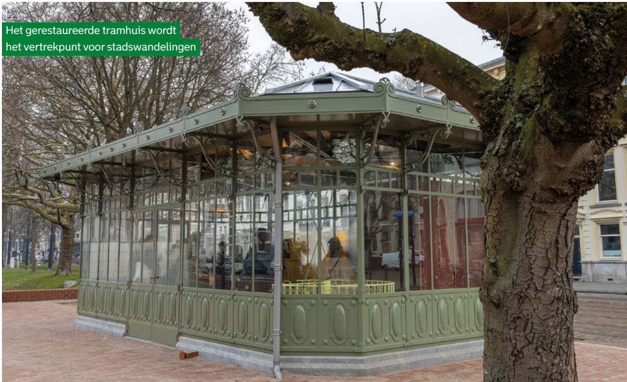
Het gerestaureerde tramhuis wordt het vertrekpunt voor stadswandelingen

Toen het in 1967 geen functie meer had als tramhuis, moest het gebouwtje eigenlijk gesloopt worden.