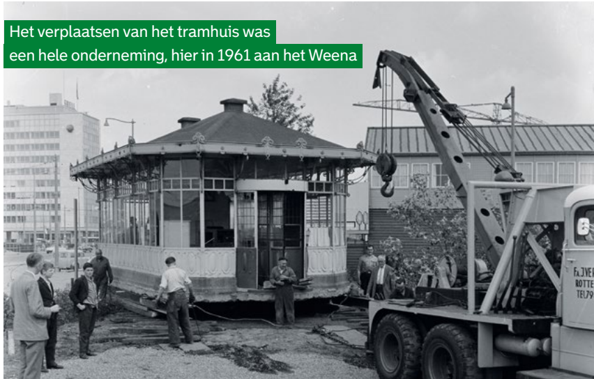
Het verplaatsen van het tramhuis was een hele onderneming, hier in 1961 aan het Weena

foto uit 1931 van het Stadsarchief. Het huisje is nu teruggeplaatst op precies dezelfde plek, op de oude kelder. Hier gaat het dienst doen als vertrekpunt voor stadswandelingen.