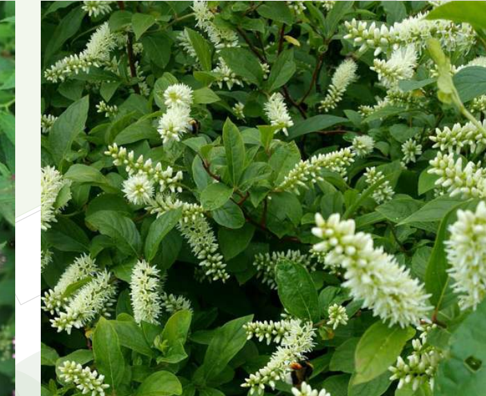
Itea virginica 'Little Henry' Bloemwilg groenblijvend | 30-40cm