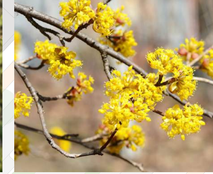
Cornus mas Gele kornoelje solitair | 100-120cm