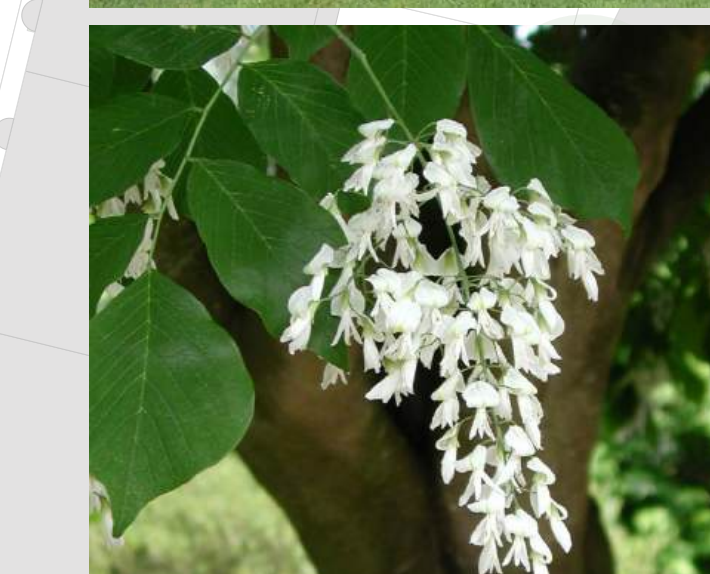
Cladrastis kentukea Geelhoutboom 25/30