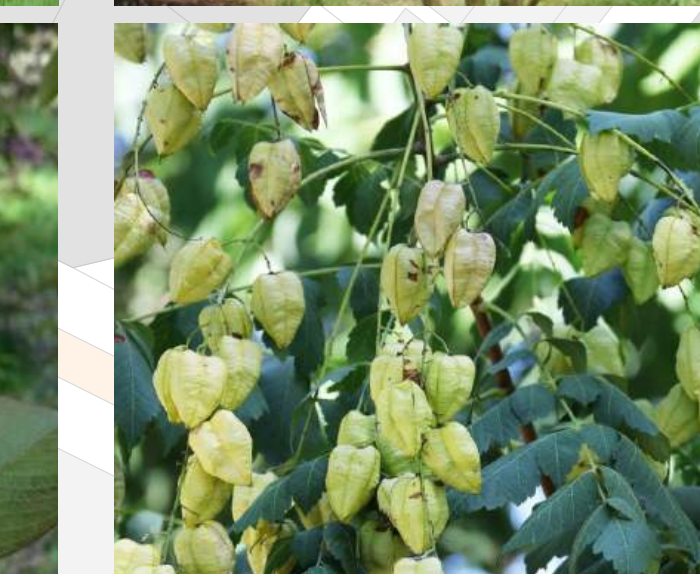
Koeleruteria paniculata Chinese vernisboom 30/35