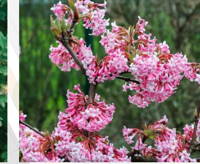
Viburnum bodnantense 'Charles Lamont' Sneeuwbal solitair | 60-80cm