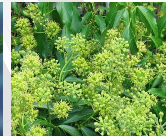
Hedera helix 'Zorgvlied' Struiklimop groenblijvend | 30-40cm