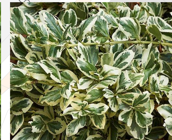
Euonymus fortunei 'Variegata' Kadinaalsmuts groenblijvend | 20-30cm