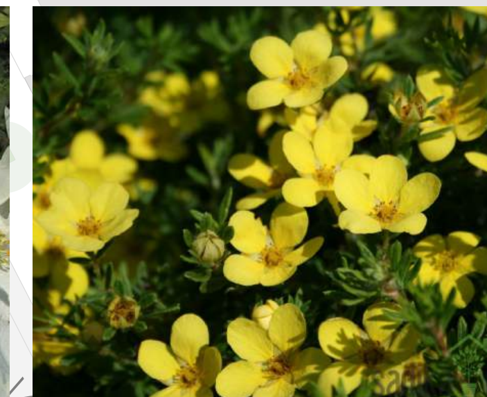
Potentilla fruticosa 'Rheingold' Ganzerik 30-40cm