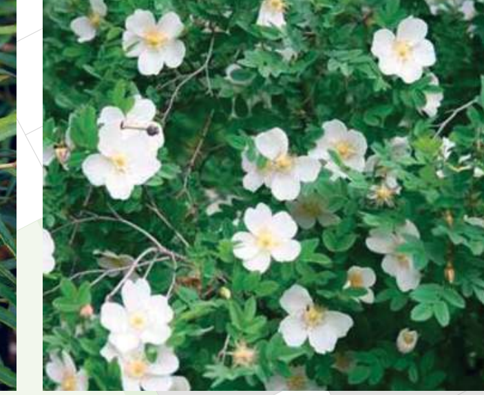
Rosa pimpinellifolia Duinroos solitair | 30-40cm