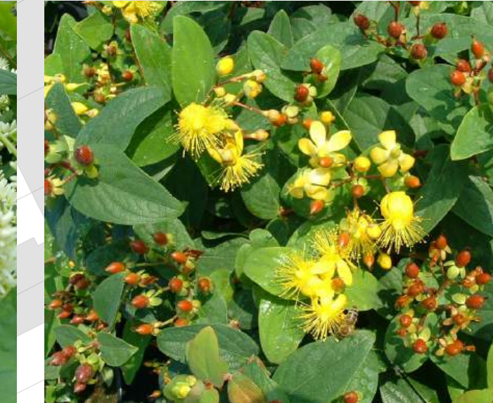
Hypericum inodorum 'Rheingold' Hertshooi groenblijvend | 30-40cm