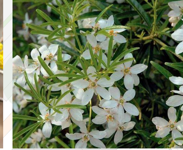
Choisya ternata 'Aztec' Mexicaanse oranjebloesem solitair | 60-80cm