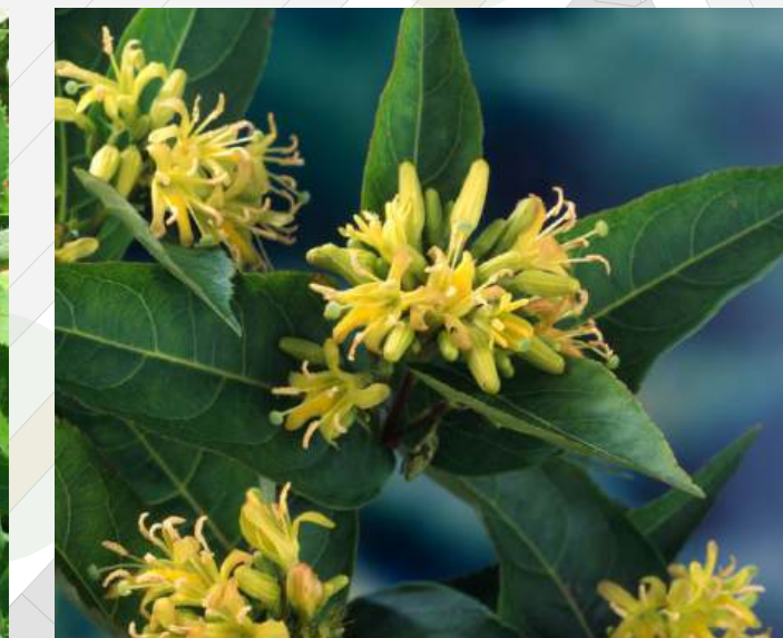
Diervilla sessilifolia 'Butterfly' Amerikaanse weigelia 30-40cm