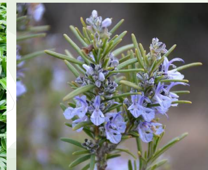
Rosmarinus officinalis Rozemarijn groenblijvend | 50-60cm