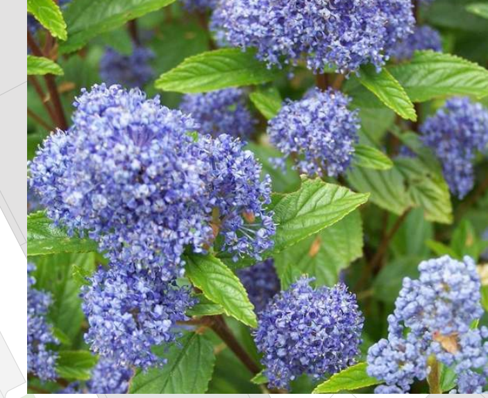
Ceanothus delilanus 'Gloire de Versailles' Amerikaanse sering solitair | wintergroen | 60-80cm

Plantvakken op stoepen bij de woningen. Zelfbeheer in overleg.