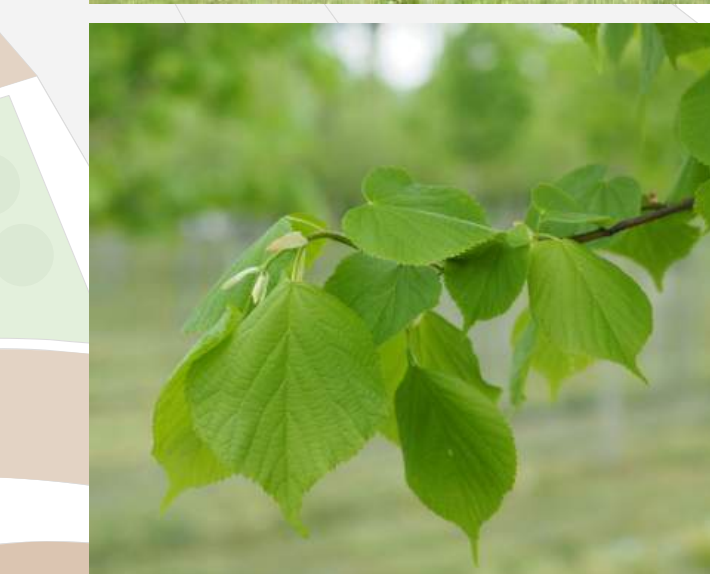
Tilia x europaea 'Koningstinde' Hollandse linde 30/35