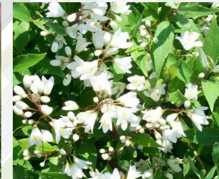
Deutzia gracilis 'Nikko' Bruidsbloem 30-40cm