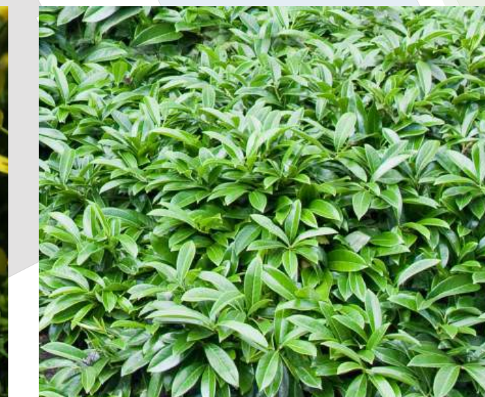
Prunus laurocerasus 'Mount Vernon' Laurier groenblijvend | 20-30cm