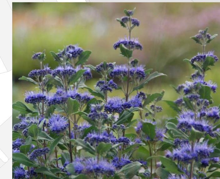
Caryopteris clandonensis 'Ferndown' Blauwbaard 30-40cm