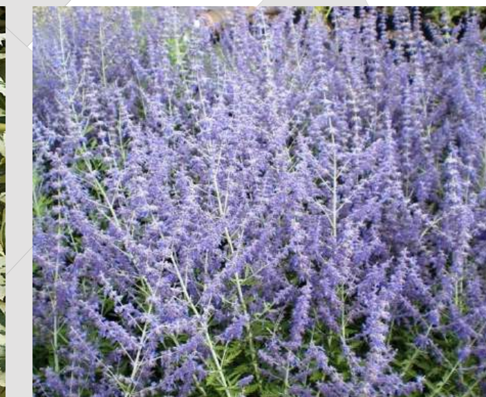
Perovskia atriplicifolia 'Little Henry' Russische salie 30-40cm