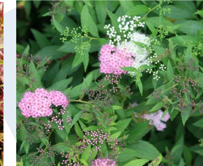
Spiraea japonica 'Genpei' Japanse spierstruik groenblijvend | 30-40cm