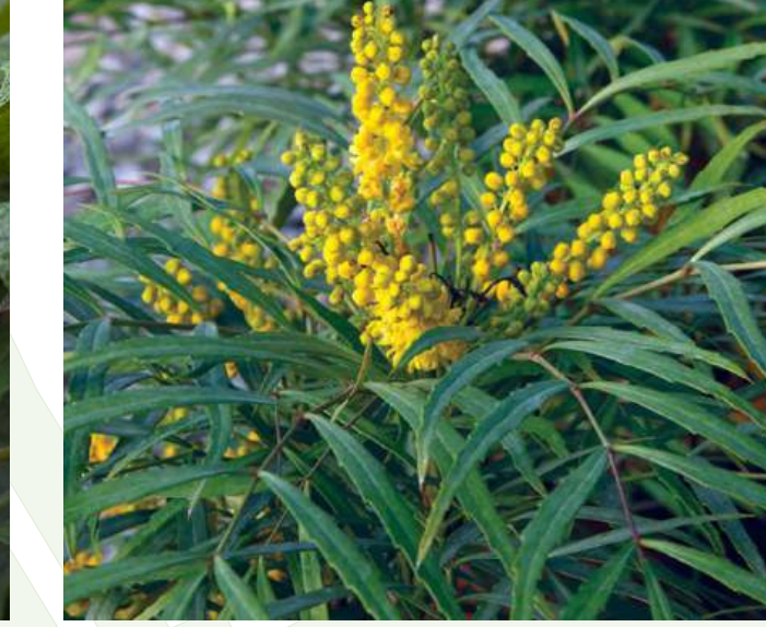
Mahonia 'Soft Caress' Mahoniestruik solitair | groenblijvend | 50-60cm