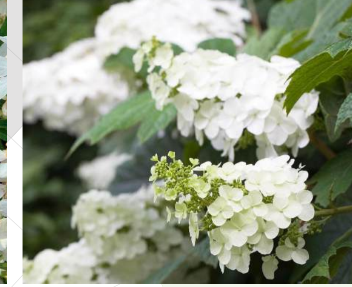
Hydrangea quercifolia 'Snow Queen' Eikenbladhortensia solitair | 60-80cm