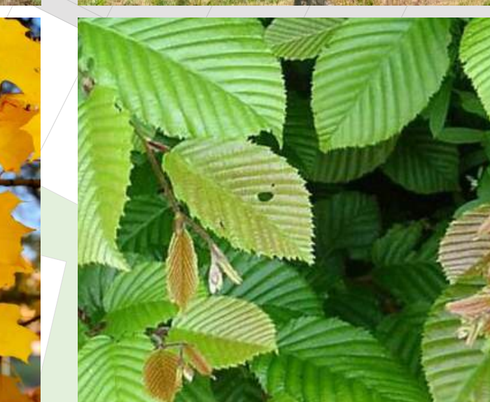
Carpinus betulus Haagbeuk 30/35