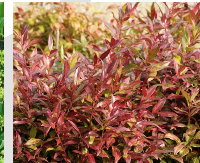
Leucothoe 'Scarletta' Druifheide groenblijvend | 30-40cm