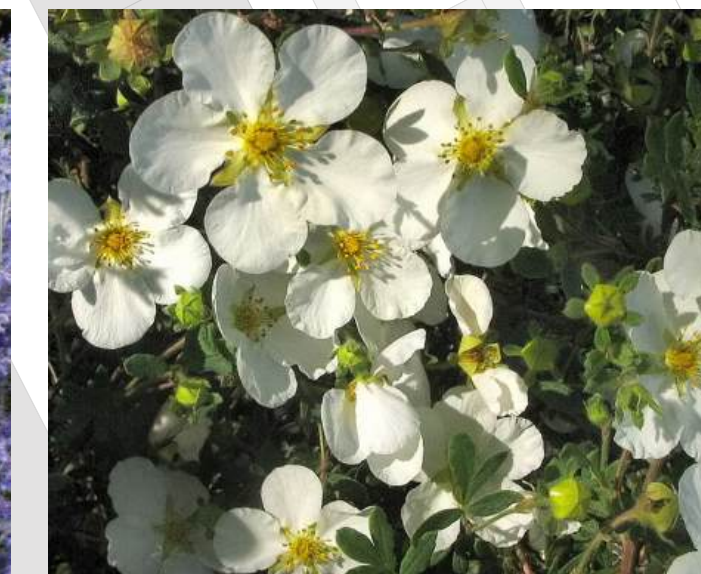
Potentilla fruticosa 'Abbotswood' Heesterganzerik 30-40cm