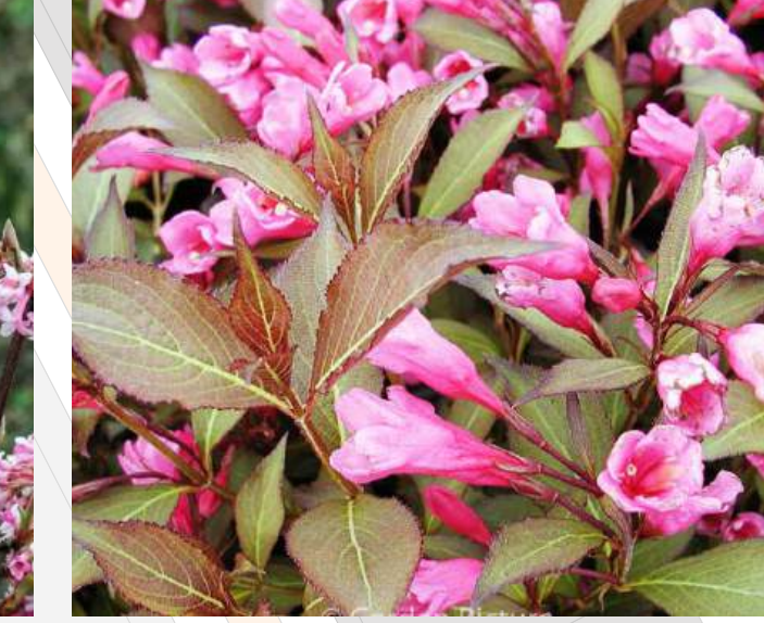
Weigela florida 'Victoria' Weigela solitair | 60-80cm