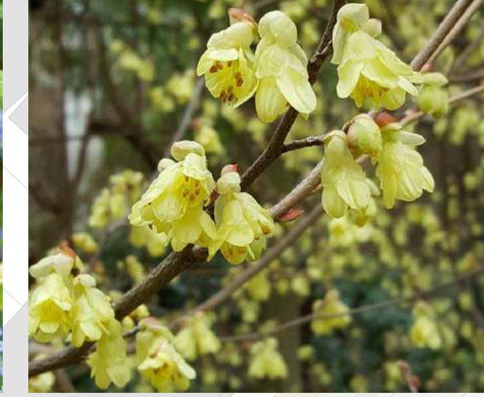
Corylopsis pauciflora Schijnhazelaar solitair | 60-80cm