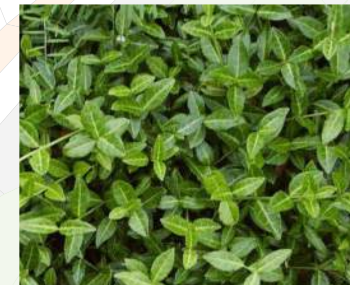
Euonymus fortunei 'Tustin' Kadinaalsmuts groenblijvend | 20-30cm