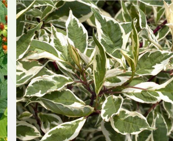
Cornus alba 'Ivory Halo' Witte kornoelje 30-40cm