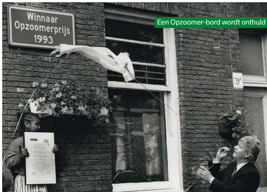
Een Opzoomer-bord wordt onthuld