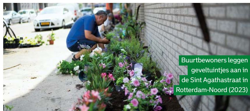
Buurtbewoners leggen gevelltuintjes aan in de Sint Agathastraat in Rotterdam-Noord (2023)

Lees er meer over op de pagina rotterdam.nl/roseknoop .