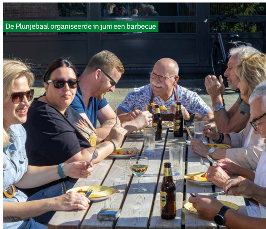
De Plunjebaal organiseerde in juni een barbecue