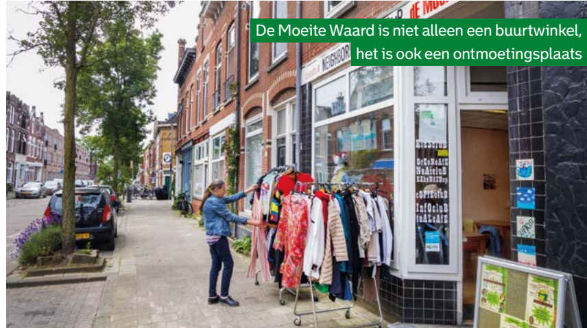
De Moeite Waard is niet alleen een buurtwinkel, het is ook een ontmoetingsplaats

De winkel kreeg ook een donatie in de vorm van een groot aantal naaimachines. Adrie: 'We gebruiken ze niet alleen om zelf kleding te herstellen of er iets mee te maken. We geven op donderdag van 10.00 tot 14.00 uur ook naailessen. Buurtbewoners leren er hoe ze zelf