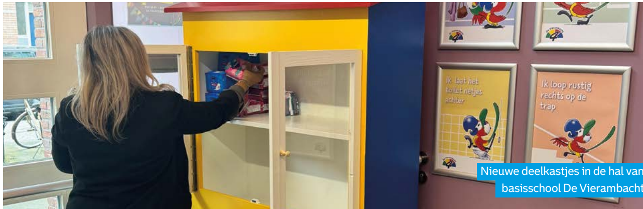
Nieuwe deelkastjes in de hal van basisschool De Vierambacht