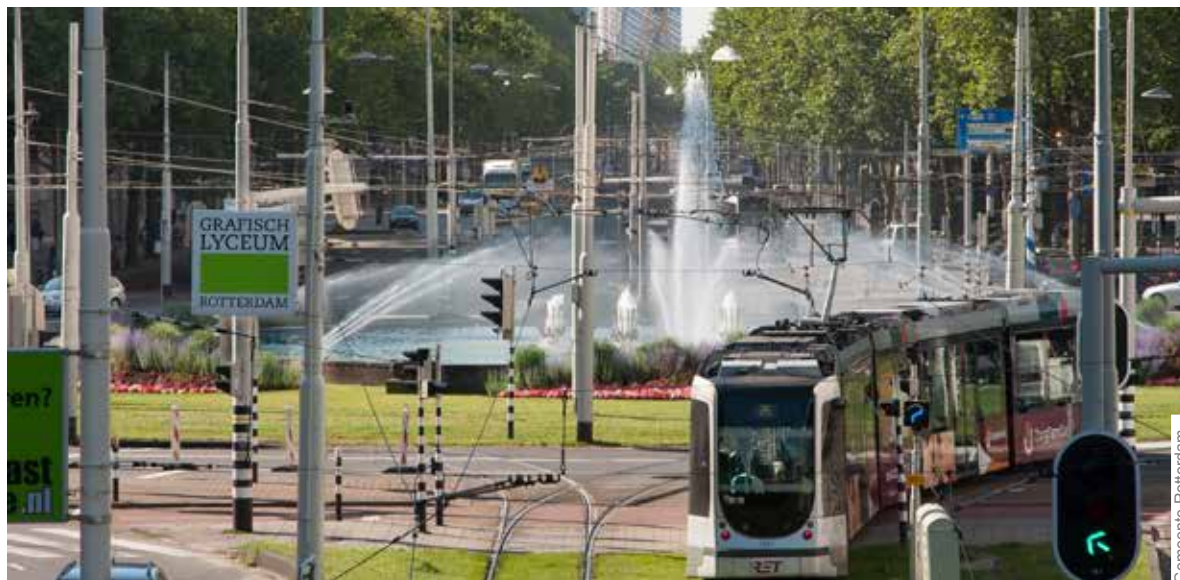
Tussen 15 en 26 augustus is vanaf het Hofplein één rijstrook afgesloten tussen 09.30 uur en 15.00 uur, ter hoogte van de werkzaamheden op de Schieweg.

Metrolijn E wordt binnenkort op sommige stukken gerenoveerd. Tussen 13 en 27 augustus is daarvoor geen metroverkeer mogelijk tussen de stations Wilhelminaplein en Maashaven. Metrolijn E rijdt alleen tussen Wilhelminaplein en Den Haag Centraal. Metrolijn D rijdt tussen Maashaven en de Akkers en tussen Wilhelminaplein en Rotterdam Centraal. In plaats van de metro rijden er pendelbussen.