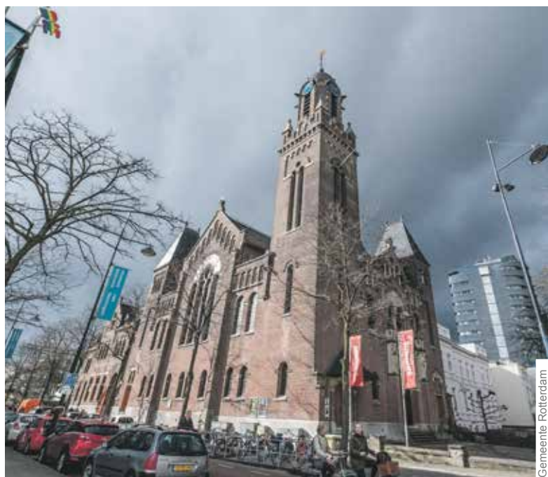
Blikvanger van de Arminiuskerk is de 45 meter hoge klokkentoren.

De Open Monumentendag, op 8 en 9 september, heeft een uitgebreid programma met rondleidingen, fietstochten en een kinderprogramma. Zo'n 65 monumenten zijn te bezoeken. Een daarvan is Arminius op de hoek Westersingel-Museumpark.