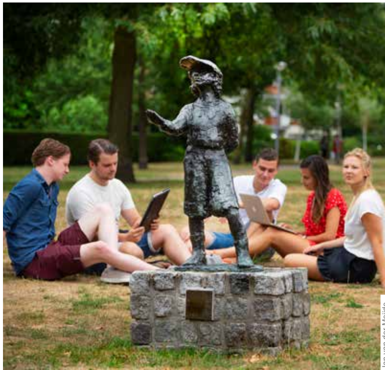
Een aantal huidige leden van studentenvereniging Laurentius bij 'hun' beeld van Boefje.

Als studentenvereniging Sanctus Laurentius in 1980 haar 65-jarig bestaan viert, willen de leden een standbeeld cadeau doen aan de stad. Na enig wikken en wegen besluiten ze Boefje te laten veeuwig. 'Onze sociëteit staat aan de rand van de Goudsesingel,