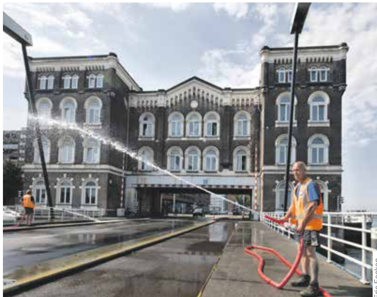
De Binnenhavenbrug wordt nu met rivierwater gekoeld tijdens warme periodes.

Deze registreren elk half uur de temperatuur van het brugdek en de constructie. De gegevens worden verwerkt in een computermodel. Ter controle worden regelmatig extra metingen gedaan. Al deze informatie laat nauwkeurig zien hoe de brug reageert op het weer. Doel is om duurzame en structurele oplossingen te vinden. Dat kan bijvoorbeeld een lichtere kleur van het wegdek zijn, of een systeem dat de brug koelt zodat die minder warm wordt.