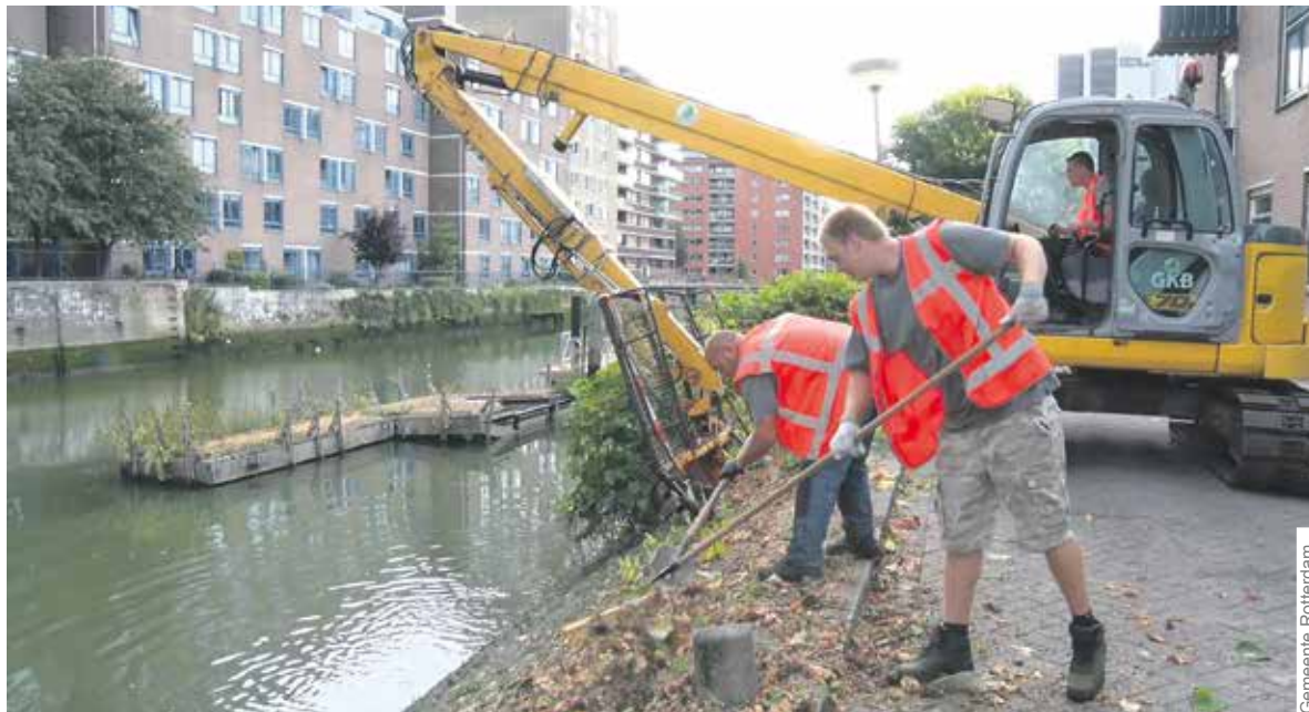
De gemeente maait de Japanse duizendknoop met een speciale machine die het maaisel direct opvangt.

De gemeente wil voorkomen dat de plant overal in Rotterdam opduikt en schade toebrengt aan huizen, dijken en wegconstructies. Daarom roept ze iedereen op om openbare locaties, waar de Japanse duizendknoop groeit, te melden. Dat kan via de BuitenBeter App of via telefoonnummer 14 010. De gemeente legt op kaart vast waar de plant voorkomt en hoe hij zich ontwikkelt. Daardoor kan de plant gerichter worden aangepakt.