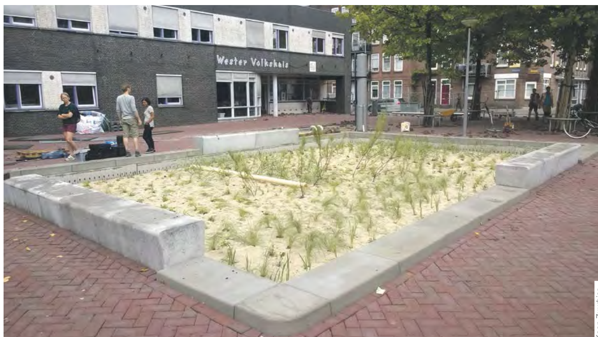
De waterbuffer in Spangen vangt regenwater op dat weer gebruikt wordt voor de grasmat in het Sparta stadion.

In het Zomerhofkwartier in Rotterdam-Noord is eind vorig jaar de Regentuin gecreëerd. In deze kleine openbare tuin wordt water van de Hofbogen opgevangen. Via een ondergrondse regenpijp gaat het water naar een verdiept deel in de tuin, dat tijdelijk als vijver kan