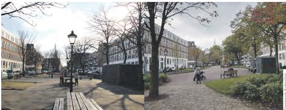
Het Burgemeester Hoffmanplein vóór en na de herinrichting en de toevoeging van méér groen.

Er komt steeds meer groen in de Tarwewijk, Bloemhof, Hillesluis, Oude Noorden en Nieuwe Westen/Middelland. De gemeente werkt hier met bewoners aan het groener maken van deze vijf wijken. Dat gebeurt door groen toe te voegen of bestaand groen te verbeteren.