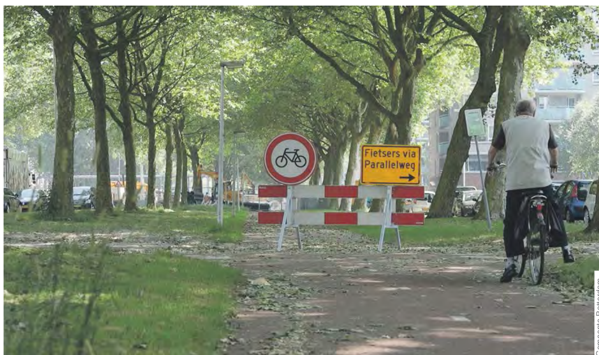
Wegens werkzaamheden is een deel van de Prinsenlaan afgesloten.