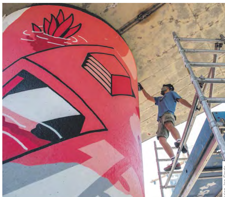
Kunstenaars uit binnen- en buitenland beschilderden de metropilaren tussen Rijn- en Maashaven.

Zo’n pilaar beschilderen is nog niet makkelijk. ‘Omdat het rond is, moeten begin en eind van de tekening op elkaar aansluiten,’ legt het Rotterdamse kunstenaarsduo Bier en Brood uit. ‘Bovendien is de onderkant smaller dan de bovenkant.’ Het duo is wel heel blij met de klus. ‘Heel gaaf om dit in je eigen stad te doen. In een andere stad is ook tof, maar hier kunnen we gewoon op de fiets langsrijden.’