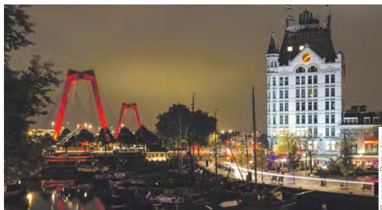
Met het aansteken van de verlichting wordt de Willemsbrug op 15 juni heropend.

werkzaamheden tijdelijk stilgelegd. In het straalgrit – dat wordt gebruikt om de oude verflaag van de brug af te stralen –