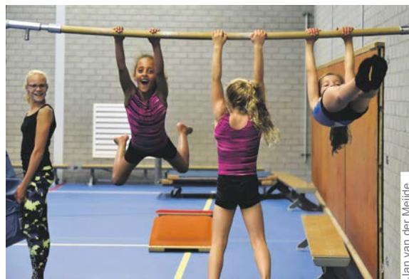
Turnvereniging HSV 1946 heeft veel jeugdleden met talent.