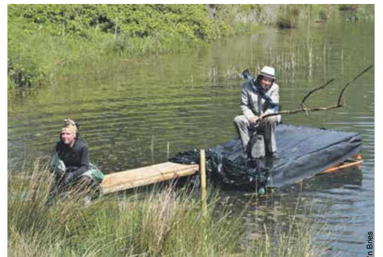
Het hele eiland is het toneel voor het stuk Waait, over mensen, stenen en de natuur.