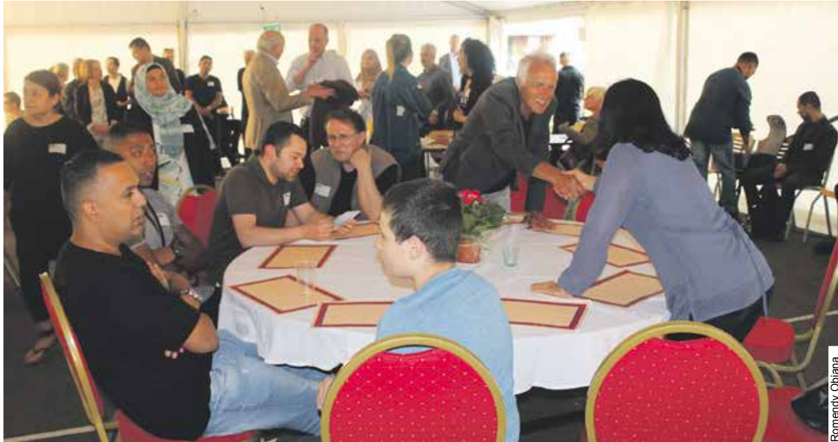
Een tent, een tafel, een goed gesprek en een feestelijke maaltijd: de juiste ingrediënten voor een vruchtbare gedachtewisseling.

Bewoners uit Hillesluis zijn volgende maand welkom voor een ontmoeting in een grote tent op het Brabantseplein. De bijeenkomst vindt plaats op zaterdag 2 juni, het derde weekend van de ramadan. Niet alleen is er na zonsondergang een feestelijke iftarmaaltijd, ook staat de avond in het teken van dialoog.