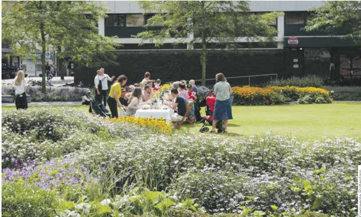
Een van de doelen uit de wijkagenda is meer groen in het Centrum, zoals hier op het Grotekerkplein.

In de wijkagenda staan de doelstellingen en opgaven om het gebied Rotterdam-Centrum leefbaar en vitaal te houden. De gebiedscommissie hoort graag wat u als centrumbewoner belangrijk vindt. Kom donderdag 12 juli meepraten in het Maritiem Museum.