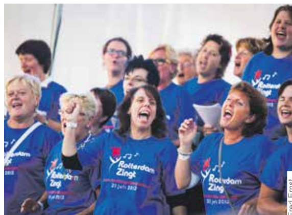
Zing 21 juli lekker mee tijdens het zangfestijn Rotterdam zingt.

In de prachtige tuin van het stadhuis kunt u op woensdag 18 juli om 20.00 uur een zomeravondconcert bijwonen. Luisteren naar flamencmuziek in de tuin én vanuit de toren. Gratis, maar wel even reserveren via www.torenmuziek.nl . Tijdens het zangfestijn 'Rotterdam zingt' wordt het Grotekerkplein op zaterdag 21 juli weer ingenomen door het allergrootste en meest gemengde koor van Rotterdam. Op het repertoire, van ABBA tot The Beatles, staan ook Rotterdamse meezingers als Ketelbinkie en Diep in mijn hart. Dinsdag 24 juli barst Rotterdam Unlimited weer los. Dompel u vijf dagen lang onder in alles wat Rotterdam te bieden heeft op het gebied van kunst en cultuur.