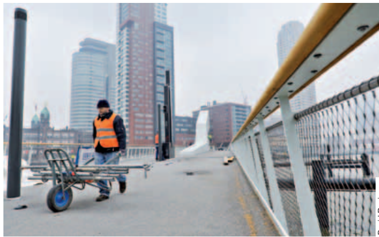
De nieuwe Rijnhavenbrug is vanaf 8 februari in bedrijf. De gemeente was maandag jl. nog druk met werkzaamheden aan de brug.