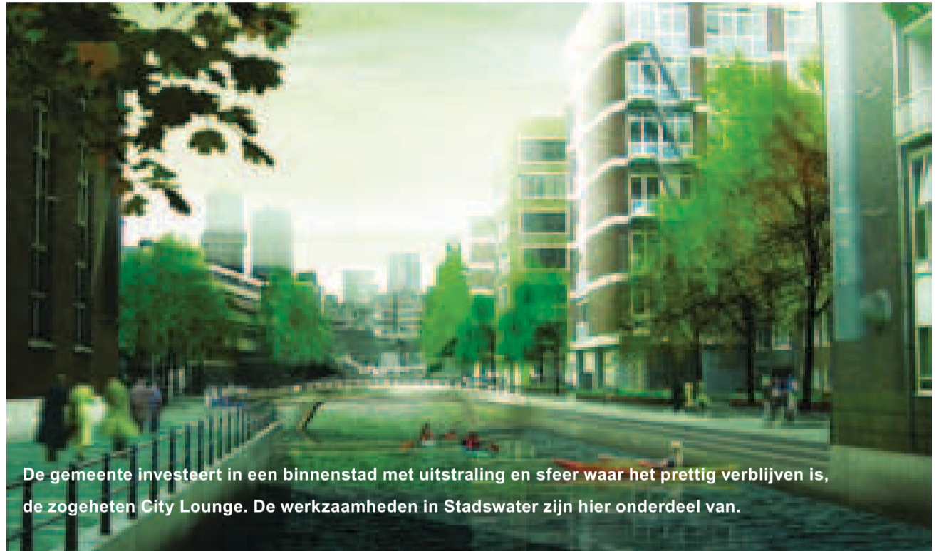
De gemeente investeert in een binnenstad met uitstraling en sfeer waar het prettig verblijven is, de zogeheten City Lounge. De werkzaamheden in Stadswater zijn hier onderdeel van.

keren in de rotzooi zitten. Behalve de nieuwe beplanting en bestrating saneren we de bodem en leggen we nieuwe riolering aan. Dat gaat zeker overlast geven. Maar als alles klaar is, ziet Stadswater er mooier en groener uit dan ooit.'