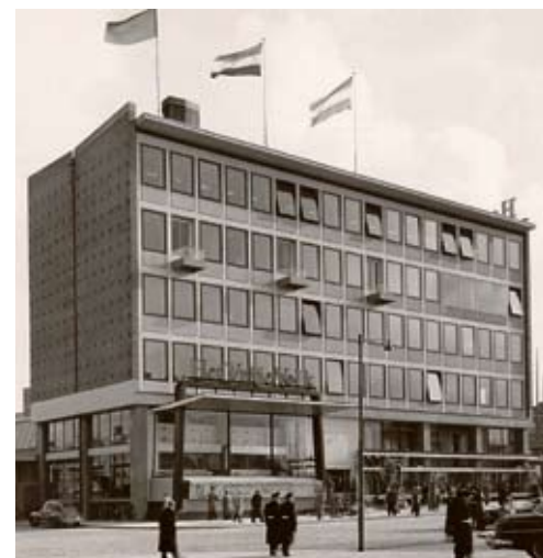
Slaakhuys in vroegere tijden