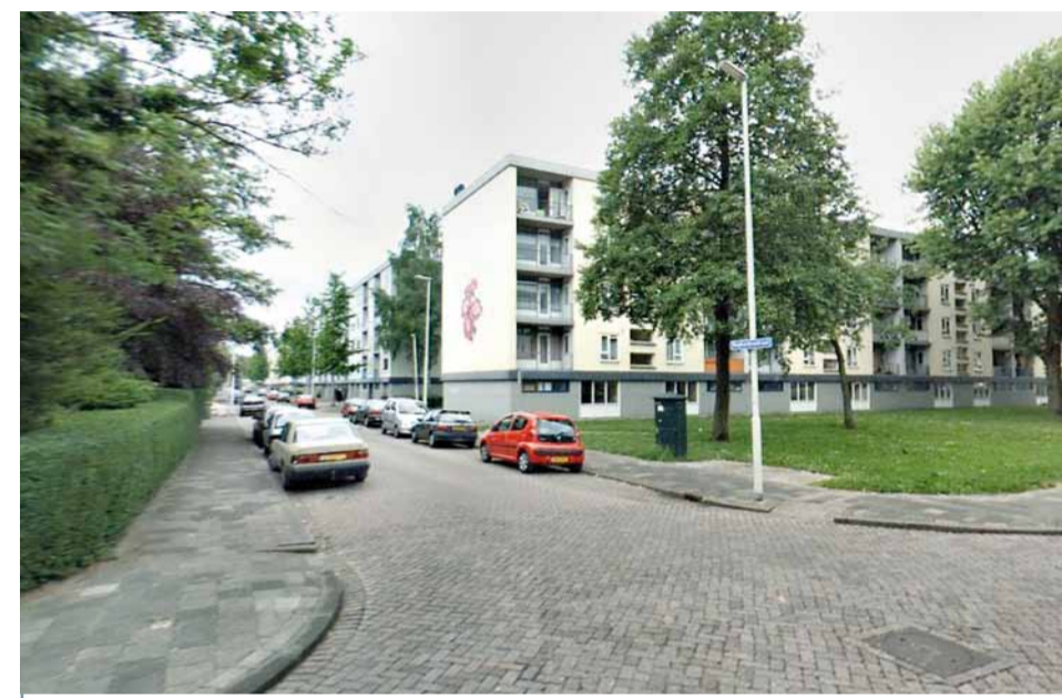
Sophoclesstraat: zowel de straat als het groen krijgt een opknapbeurt

Ook is geld beschikbaar voor gazon- en plantsoenherstel, omvorming bosplantsoen en het boomonderhoud. Voor het groen is eveneens een budget periodiek- en storingsonderhoud.