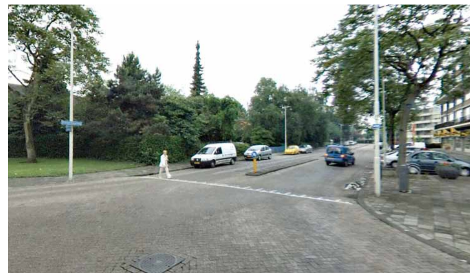
Schopenhauerweg: dit jaar staat de riool vernieuwing met herbestrating Schopenhauerweg en Bierens de Haanweg in de planning

Volgend op het projectmatig onderhoud wegen wordt ook het hier aanwezige groen opgeknapt.