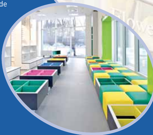
De nieuwe bibliotheek aan de Herenwaard

U vindt de nieuwe bibliotheek aan de Herenwaard 15, 3078 AK Rotterdam. Wilt u meer weten over wat er te doen is de bibliotheek? Of wilt u informatie over de andere bibliotheken in Rotterdam? Kijk op www.bibliotheek.rotterdam.nl