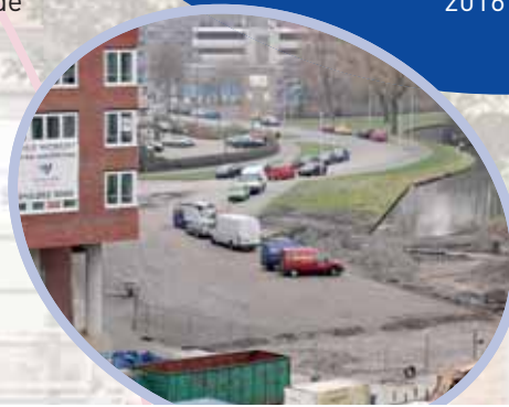
Het tracé loopt langs de singel naar het plein

De gesprekken over fase 2 van het Hart IJsselmonde, de uitbreiding en renovatie van winkelcentrum Keizerswaard, gaan gestaag door. Zodra er tussen de ontwikkelaar DCIJ en de Coöperatieve Vereniging van Eigenaren Keizerswaard overeenstemming is over de commerciële uitgangspunten kan de samenwerkingsovereenkomst voor de 2e fase worden ondertekend en het kaderplan worden afgerond, waarna een planning van de diverse deeltrajecten en vergunningsprocedures kan worden opgesteld. Een eindoplevering van het gehele project zou eind 2016 mogelijk zijn.