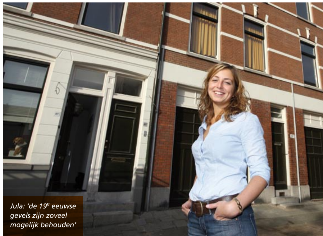
Jula: 'de 19 e eeuwse gevels zijn zoveel mogelijk behouden'

'Sinds februari wonen we in ons nieuwe huis in de Zijdewindestraat. Het is hier heerlijk. We zitten in hartje centrum, in de buurt van alle voorzieningen, maar toch in een rustige straat. We hebben zelfs een tuin. Het pand heeft van buiten nog steeds de uitstraling van oudbouw, wat toch uniek is in deze stad. Van binnen heeft het alle gemakken van nieuwbouw.'