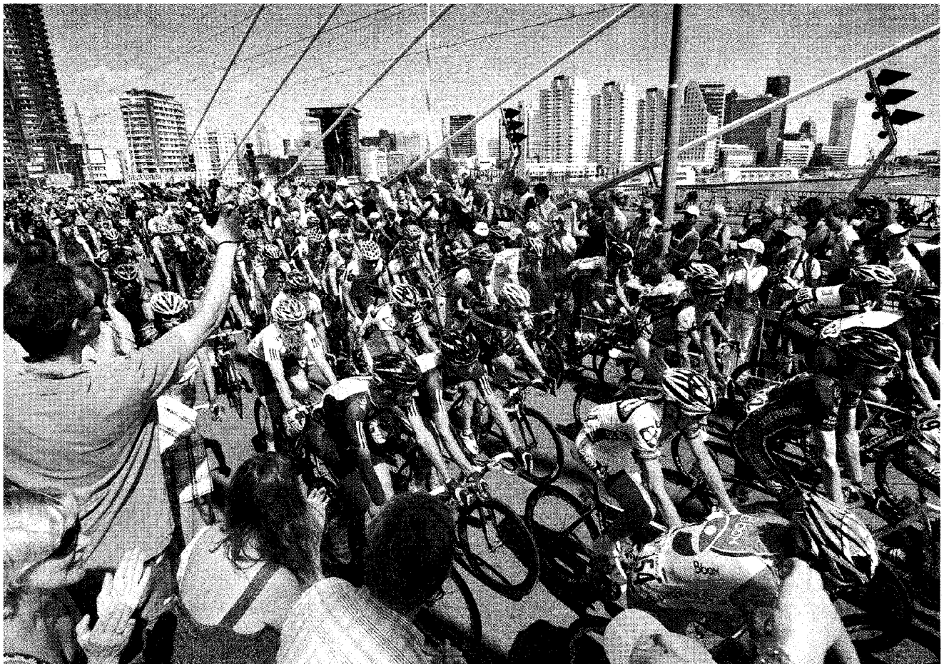
Op 4 juli 2010 passeerde de Tour de France de Erasmusbrug. Volgens sportwethouder Antoinette Laan (VVD) is de uitstraling van het evenement 'gigantisch' geweest, net als dat van het WK turnen, later dat jaar in Ahoy.